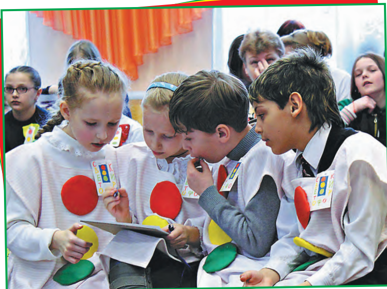
Фото Н. СМОРОЧНОВОЙ, г. Москва

Всегда носи специальные предметы со световозвращающими элементами , чтобы тебя было хорошо видно на дороге в тёмное время суток и в пасмурную погоду.